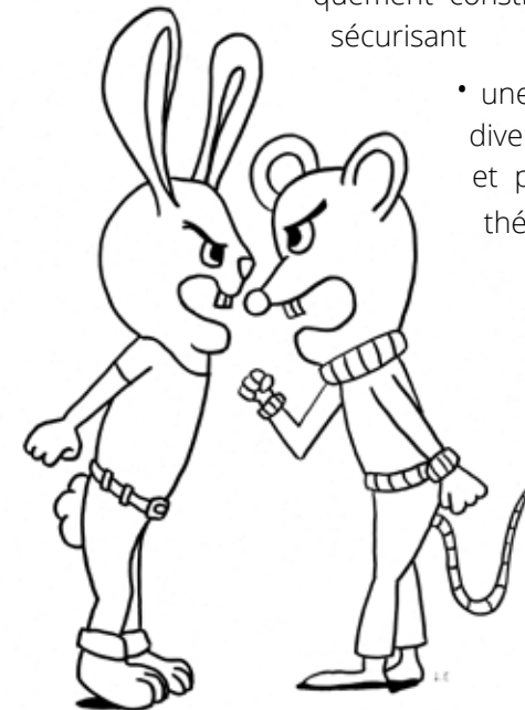
Ce dessin sur le thème du conflit fait partie d'une série téléchargeable librement sur yapaka.be pour démarquer les ateliers de la pensée joueuse. Illustrations de Ludovic Flamant