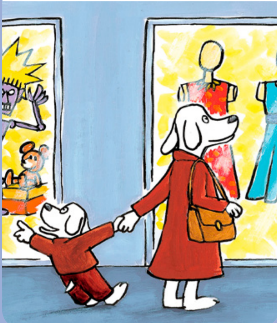
• Tout, tout de suite !