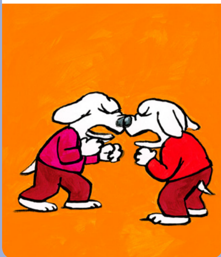
• On se dispute ou on discute ?