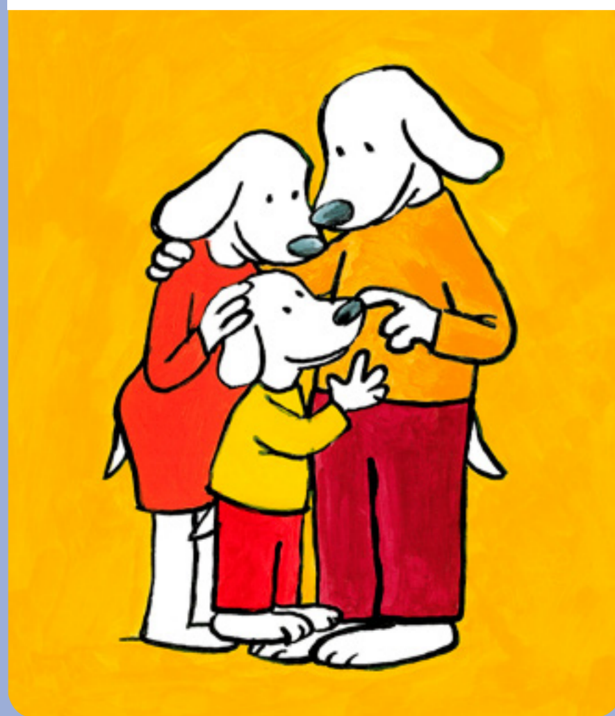
• Des câlins : à temps plein ?