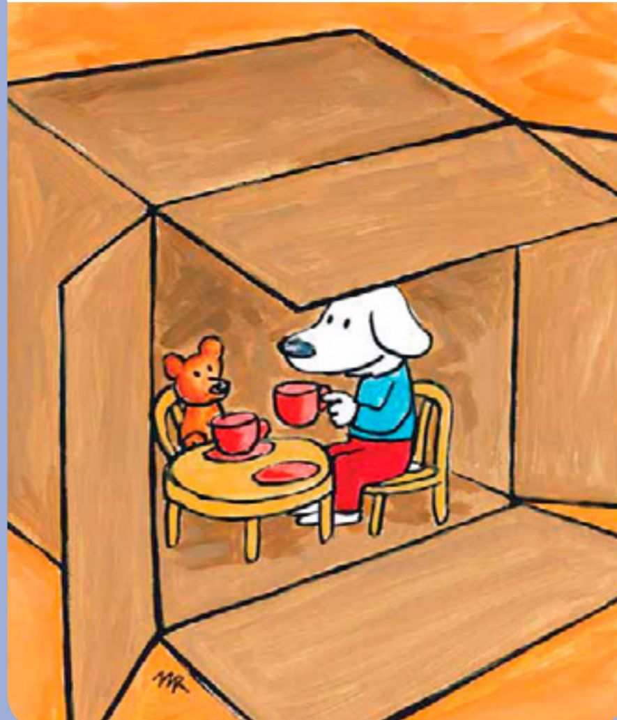
• Place aux artistes