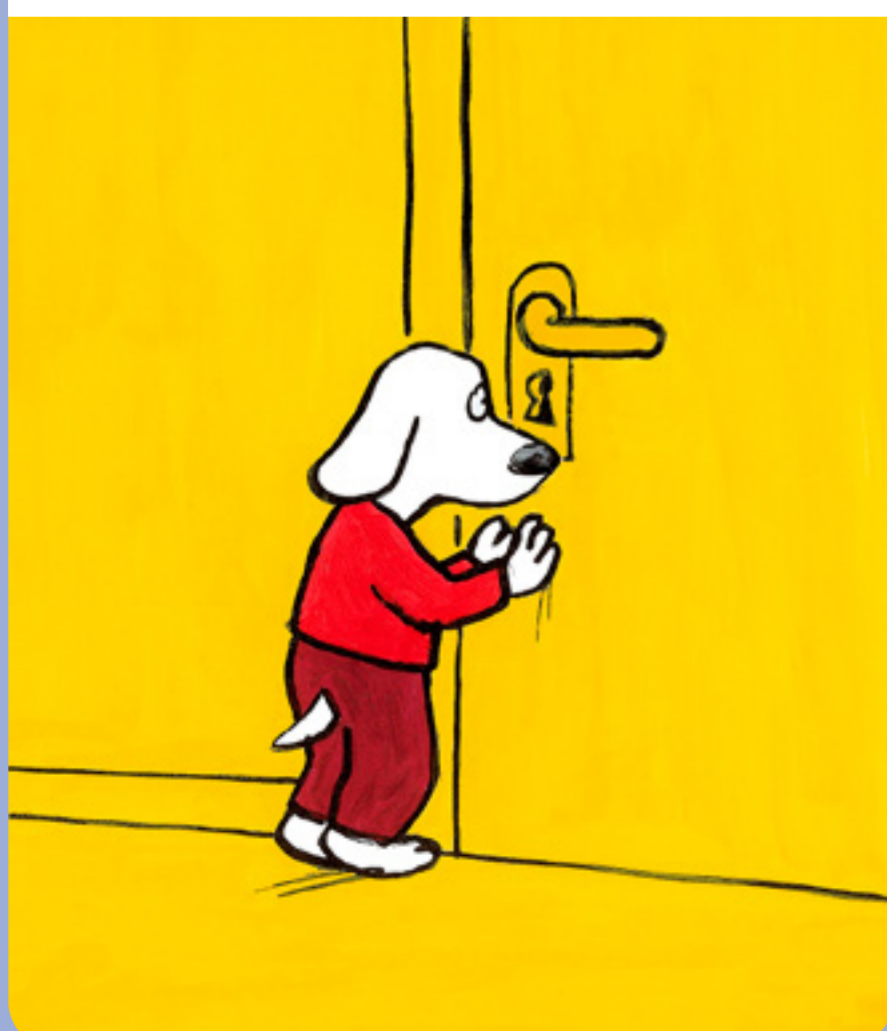
• Je veux tout savoir