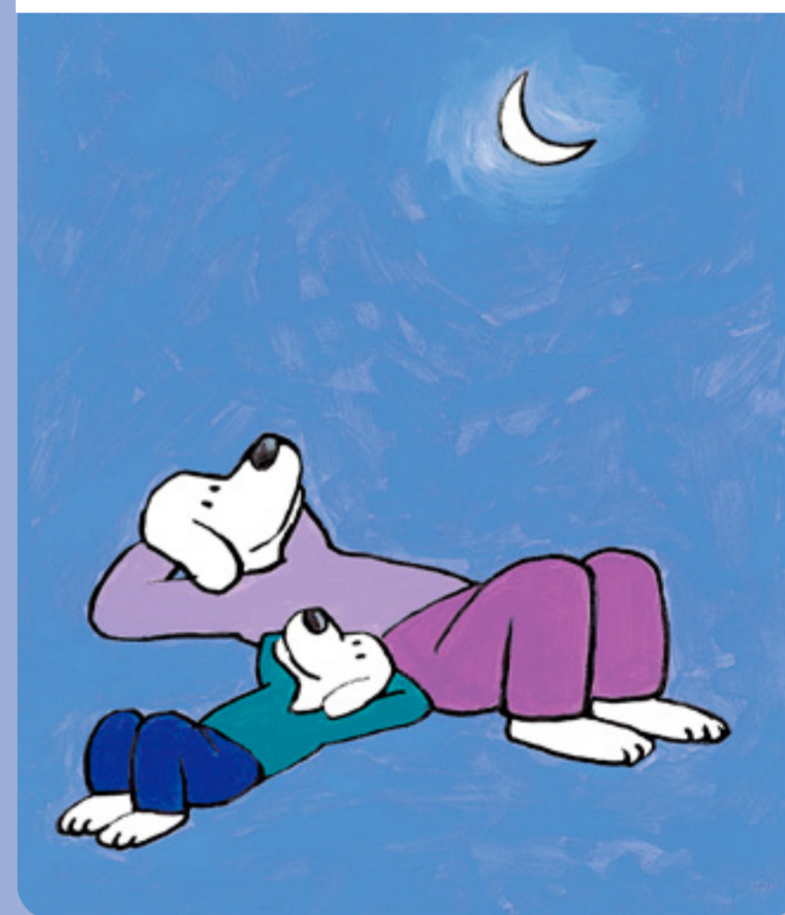
• Ne rien faire, c'est super