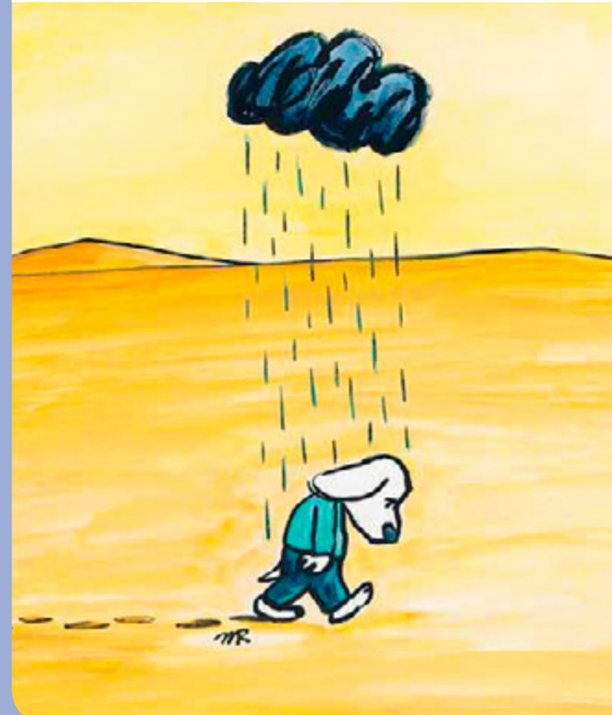
• Quand ça ne tourne pas rond